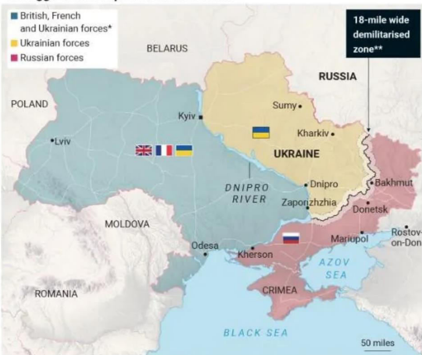
Kellogg's vision of post-conflict Ukraine

*May include other "coalition of the willing" European allies **It is unclear if the buffer zone would extend along the Ukraine-Russia border Graphic by The Times and Sunday Times