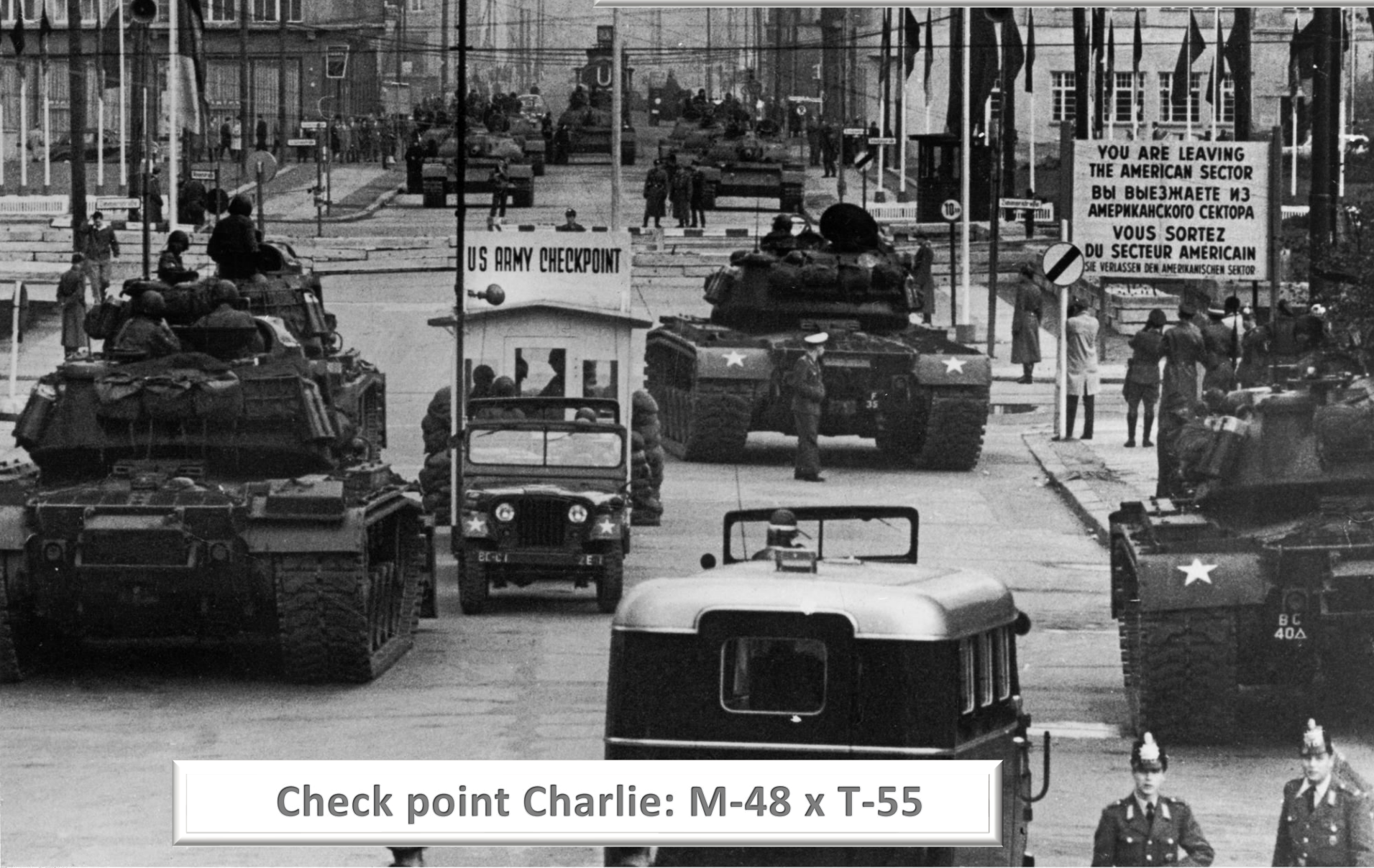
Check point Charlie: M-48 x T-55