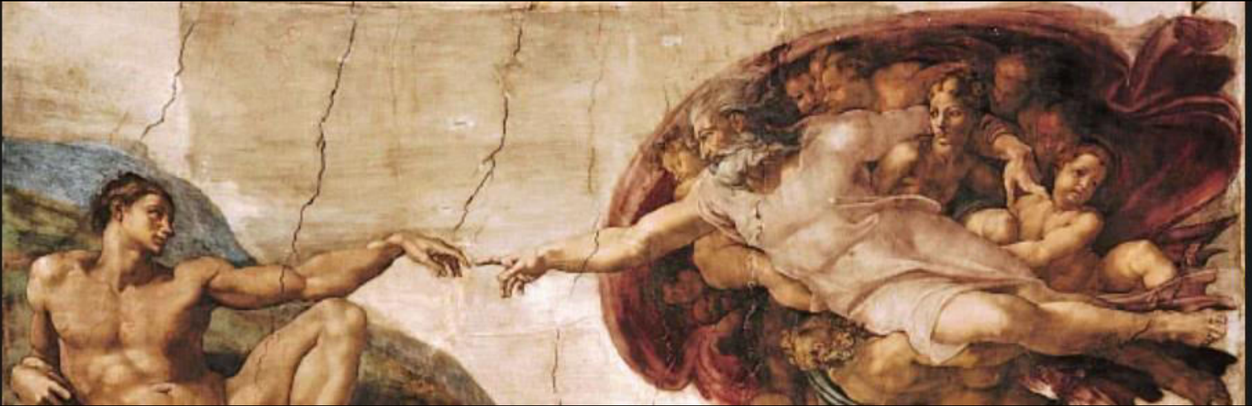
“A Criação de Adão” Michelangelo, 1511, Capela Sistina

“Deus criou o Homem à sua imagem e semelhança” Genesis 1, 27