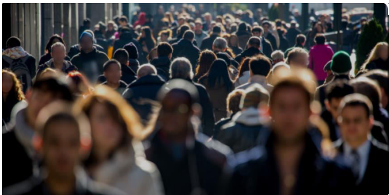
A Sociedade Diversa